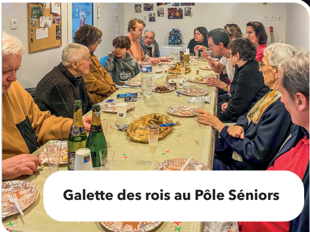
Galette des rois au Pôle Séniors

Les journées séniors ont donné lieu à de nombreuses animations, notamment un goûter dansant.