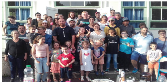
Fête des voisins à Carbonat, le 25 mai