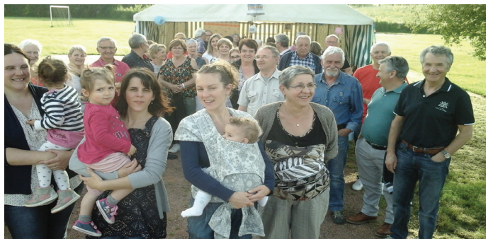
Fête des voisins aux Planières, le 25 mai