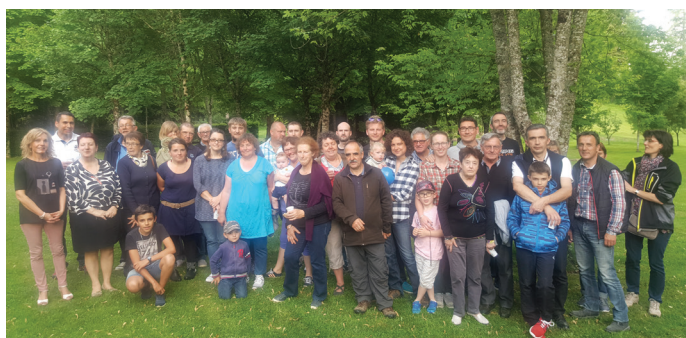
Fête des voisins de la pépinière, le 25 mai