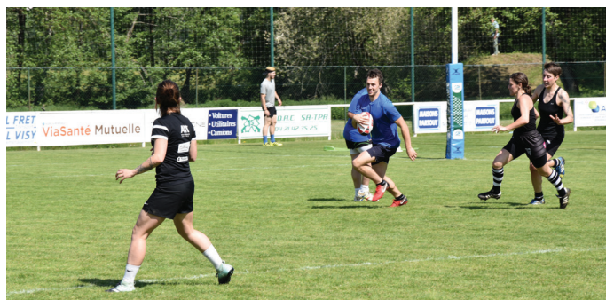
Tournoi de rugby à toucher, le 19 mai