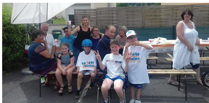
Fête des voisins à Cols, le 2 juin