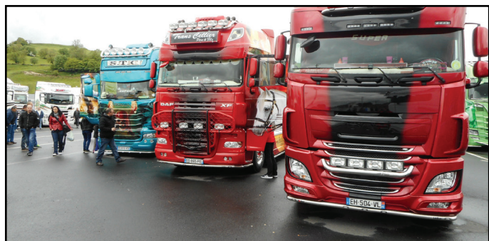
Les Truck'Coeur 15, les 12 et 13 mai