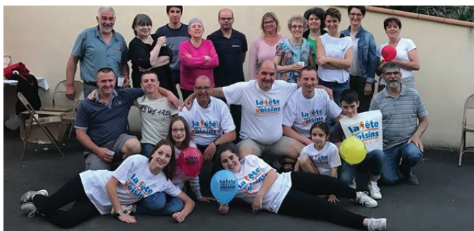
Fête des voisins lotissement Henri Matisse, le 25 mai