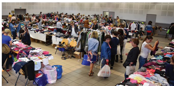
Vide-dressing du comité d'animation, le 3 juin