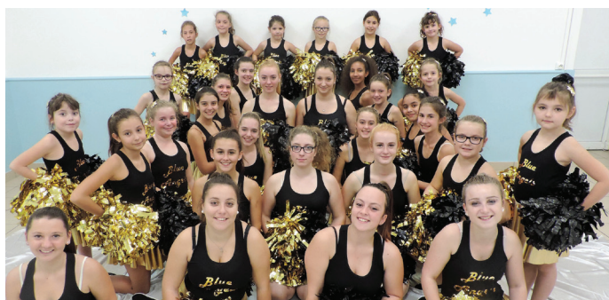
Gala des Blue Angels, le 26 mai