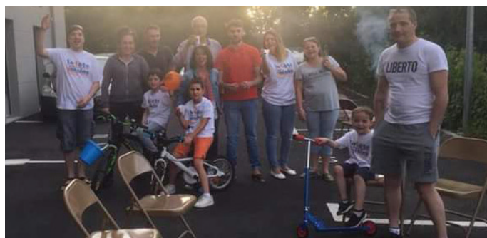
Fête des voisins 29 rue Louis Dauzier, le 25 mai