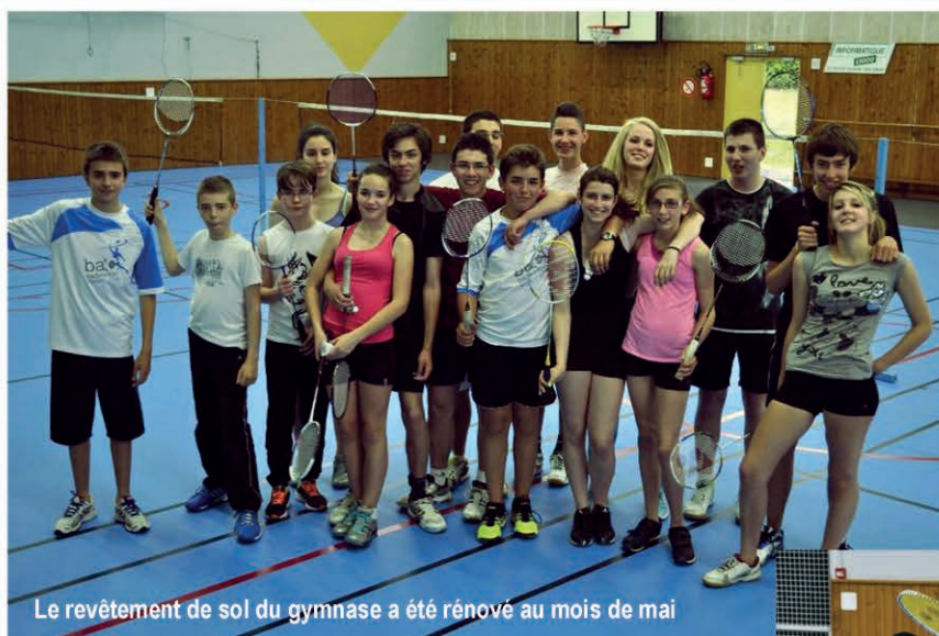
Le revêtement de sol du gymnase a été rénové au mois de mai

Cette saison, le Badminton Arpajon Club (B.A.C) compte 98 licenciés (46 jeunes et 52 adultes) contre 52 pour l'année dernière.