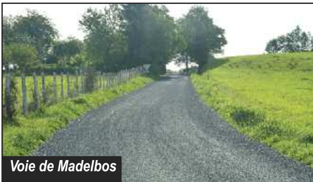
Voie de Madelbos

Le programme a été réalisé durant les mois de juillet et de septembre sur les voies communales suivantes : allée des Tilleuls, antenne du Square Claude Bernard, chemin de Parrot, allée du Couderc, antenne des Granges, chemins des Baudières et du Fanga, allée de Conros, place de Roquette, rues Hyppolyte Dejou, du Mont Mouchet, voies de Brouzadet, de Madelbos, de Carsac, d'Imbert, du Bousquet et du giratoire Redondette à la zone du Bousquet.