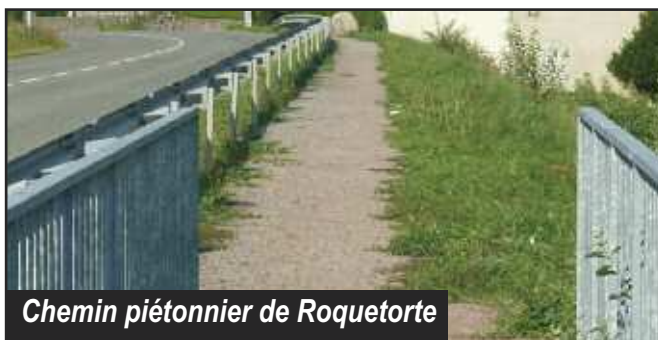
Chemin piétonnier de Roquetorte

Pour accentuer la sécurité aux abords de cet établissement, la collectivité a réalisé un plateau surélevé au niveau du carrefour de la route départementale n° 58 (en direction de Carbonat) et la rue de la cité du Puy Gioli.