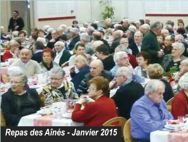
Repas des Aînés - Janvier 2015

Mieux prendre en compte les personnes âgées dans la ville, c'est être aussi à l'écoute de leurs besoins et de leurs aspirations.