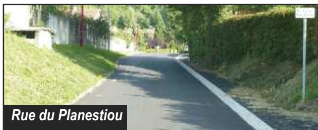
Rue du Planestiou

Rues du Planestiou, des Crozes et des Camps : La Communauté d'Agglomération du Bassin d'Aurillac avait réalisé des travaux de reprises sur les réseaux d'adduction d'eau potable et d'assainissement en 2014.