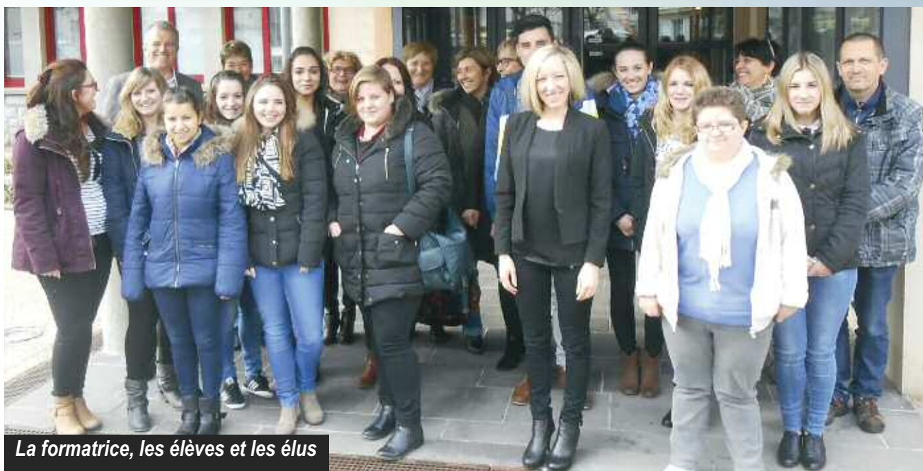
La formatrice, les élèves et les élus

Les élèves ont procédé à l'enquête auprès de l'échantillon de la population ciblée, durant la semaine du 23 au 26 février 2015.