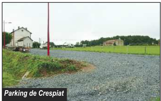
Parking de Crespiat