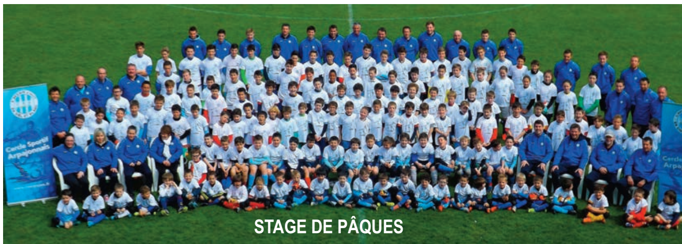
STAGE DE PÂQUES

Les nombreuses actions mises en place par l'équipe dirigeante ont permis au club d'obtenir la labellisation «Excellence» de l'école de Foot.